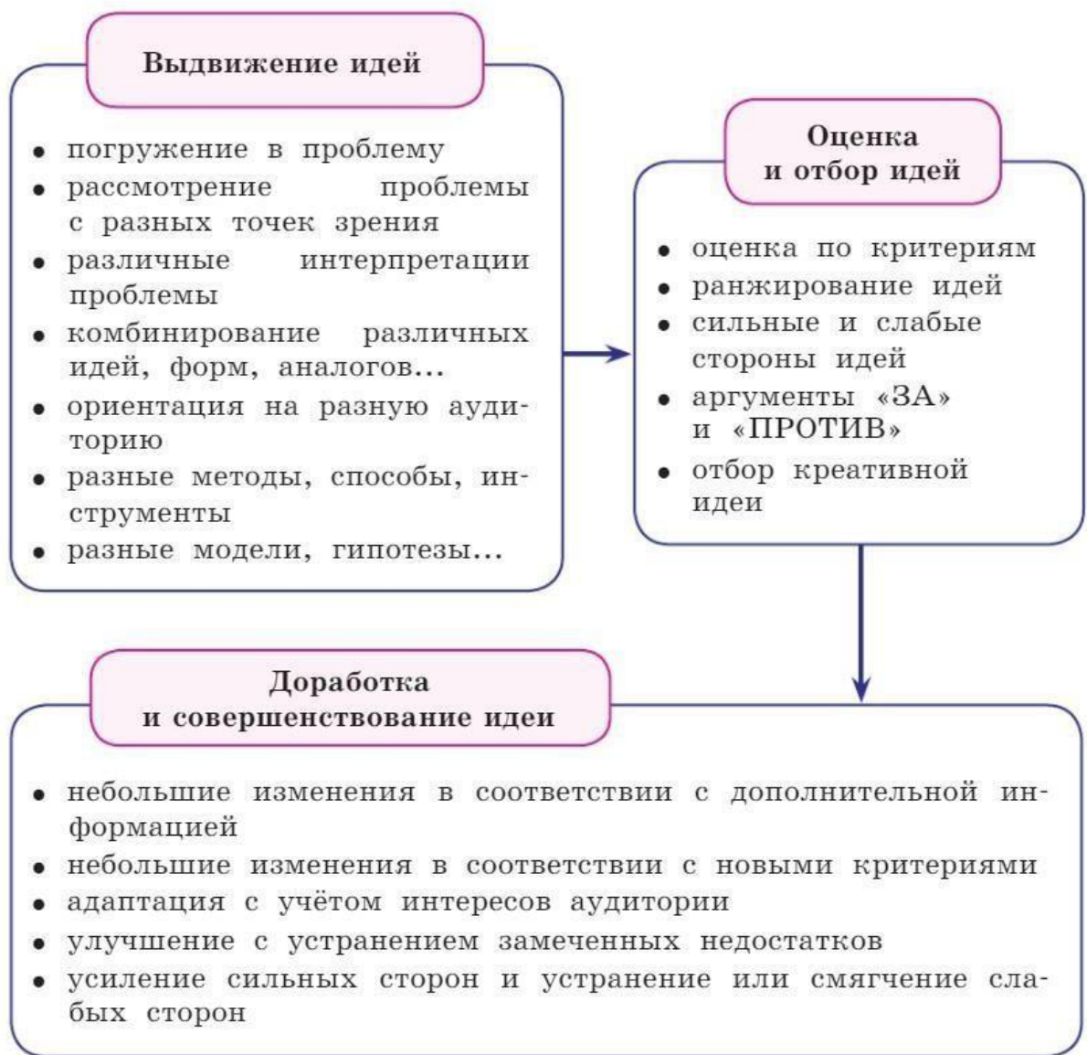
Рисунок 2. Действия, требуемые при выполнении заданий на креативность

При оценивании заданий учитывается, что креативная идея (решение) – это всегда идея: